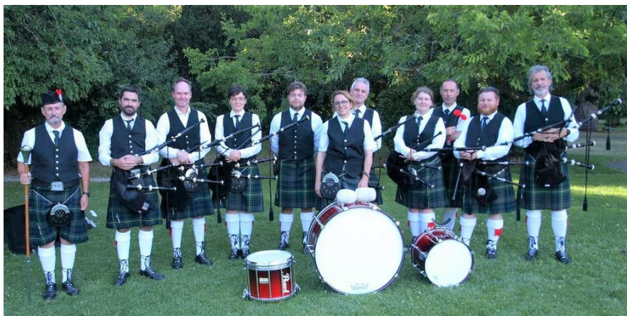
Le Aquitaine Highlanders Pipe Band, Champion de France 2022