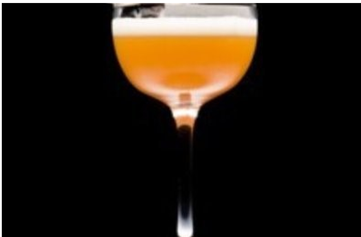
Le cocktail de MAI 2019