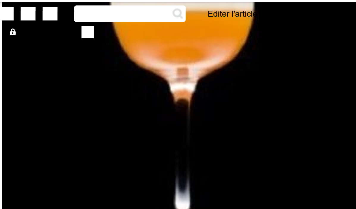
Le cocktail de MAI 2019